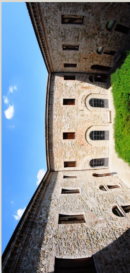
Padiglione Bonucci – Il Chiostro

Via Enrico dal Pozzo, snc Padiglione Bonucci 06126 | Perugia | PG Tel. 075.585.6800 – 6839 E-mail: didattica.cla@unipg.it