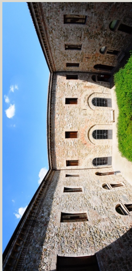
Padiglione Bonucci – Il Chiostro

Via Enrico dal Pozzo, snc Padiglione Bonucci 06126 | Perugia | PG Tel. 075.585.6800 – 6839 E-mail: didattica.cla@unipg.it